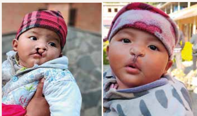
Typische Doppelseitige Lippenspalte vor und nach der OP.