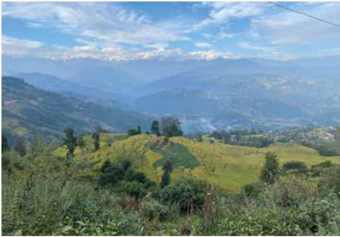
Vor dem mächtigem Langtang Gebirgsmassiv erscheint die dichtbesiedelte Mittelgebirgslandschaft.